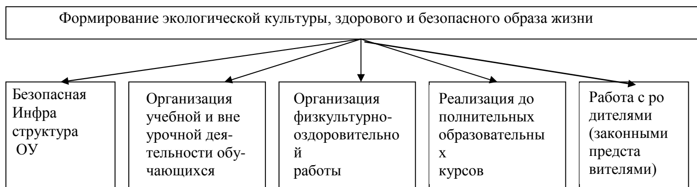
Рис. 2.2. модель организации работы МБОУ «Углицкая СОШ» по формированию у обучающихся экологической культуры здорового и безопасного образа жизни

Экологически безопасная, здоровьесберегающая инфраструктура МБОУ «Углицкая СОШ» включает: